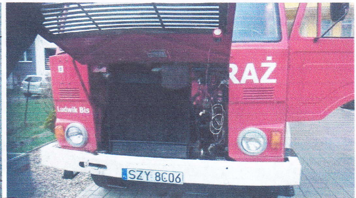
Samochod Specjalny Pożarniczy GCBA67/328