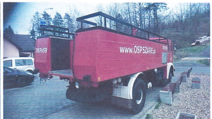
Samochod Specjalny Pożarniczy GCBA67/321