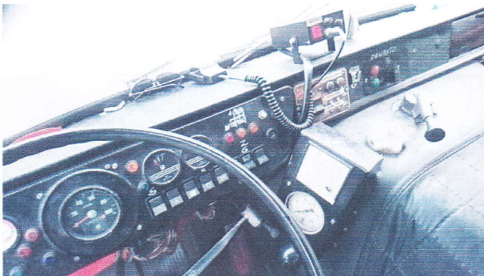
Samochod Specjalny Pożarniczy GCBA67/324