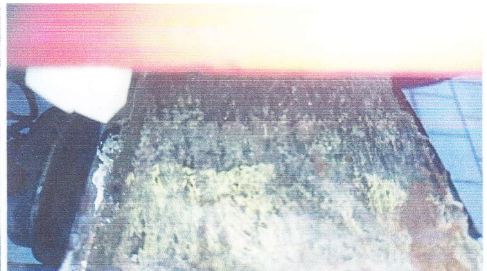
Samochod Specjalny Pożarniczy GCBA67/325