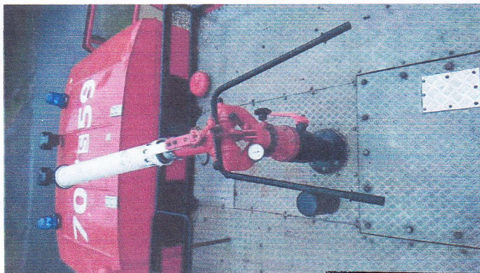
Samochod Specjalny Pożarniczy GCBA67/326