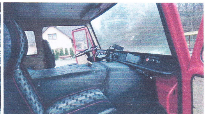
Samochod Specjalny Pożarniczy GCBA67/327