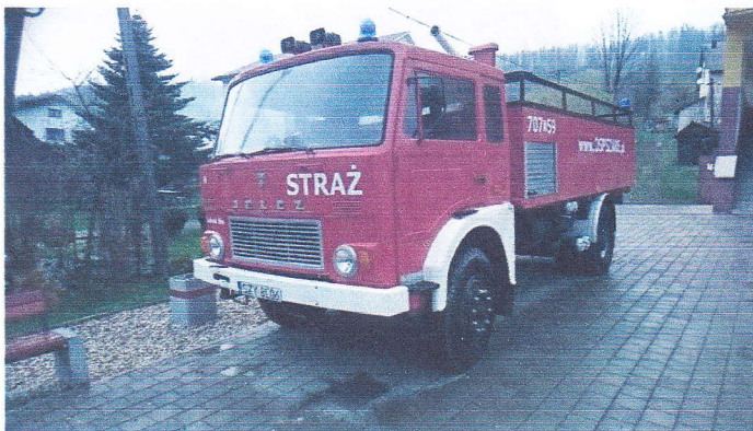
Samochod Specjalny Pożarniczy GCBA67/322