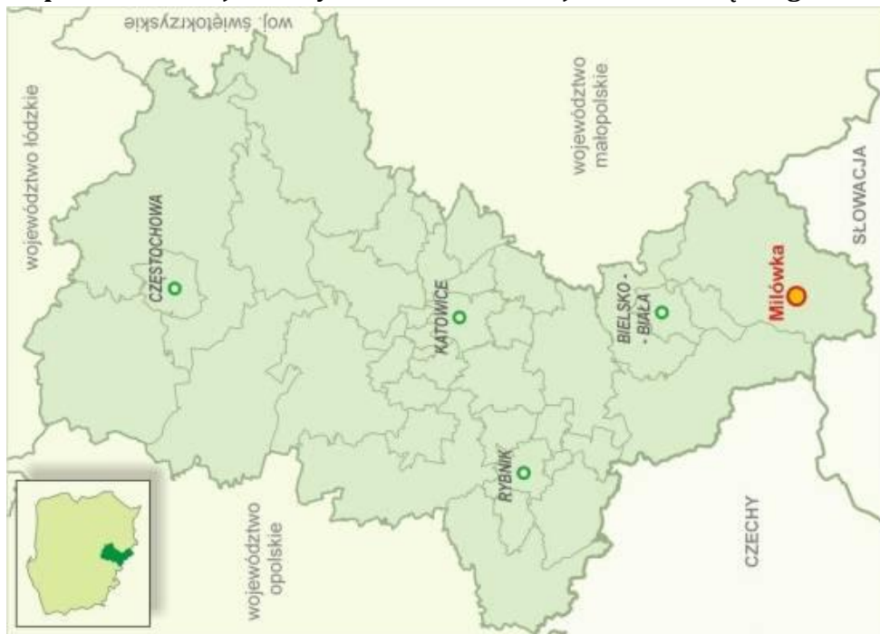
Mapa 1. Lokalizacja Gminy Milówka na tle Województwa Śląskiego