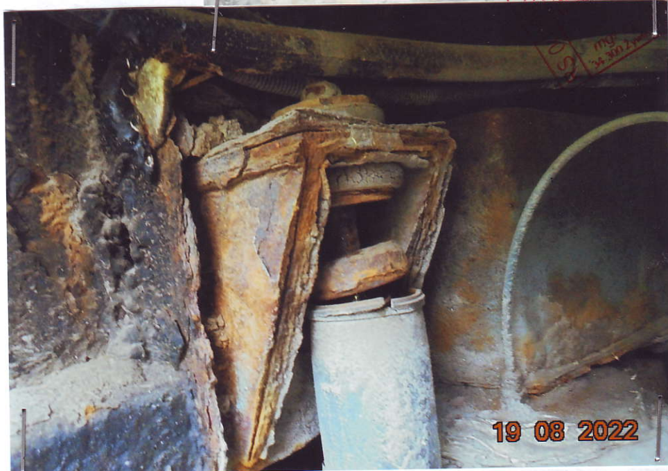
(10) Zbliżenie na uszkodzony lewy tylny amortyzator, skorodowanie konstrukcji zawieszenia, aktualnie lewa strona tylnego zawieszenia uszkodzona !!! .