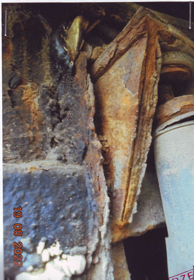
(11) Tył autobusu – lewa strona Ujęcie lewej strony zawieszenia - końcówka ramy , skorodowana , rozwarstwiona , lewy tylny amortyzator uszkodzony ,elementy wzmocnienia płyty podłogowej ( poprzeczki ) skorodowane .

AUTOBUS SOR C9,5 o nr rejestracyjnym SZY 14708