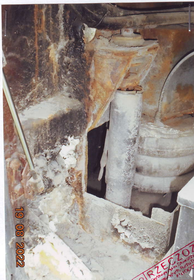
(9) Tył autobusu – lewa strona Ujęcie lewej strony zawieszenia - końcówka ramy , lewy tylny "miech", komory sinika .

AUTOBUS SOR C9,5 o nr rejestracyjnym SZY 14708