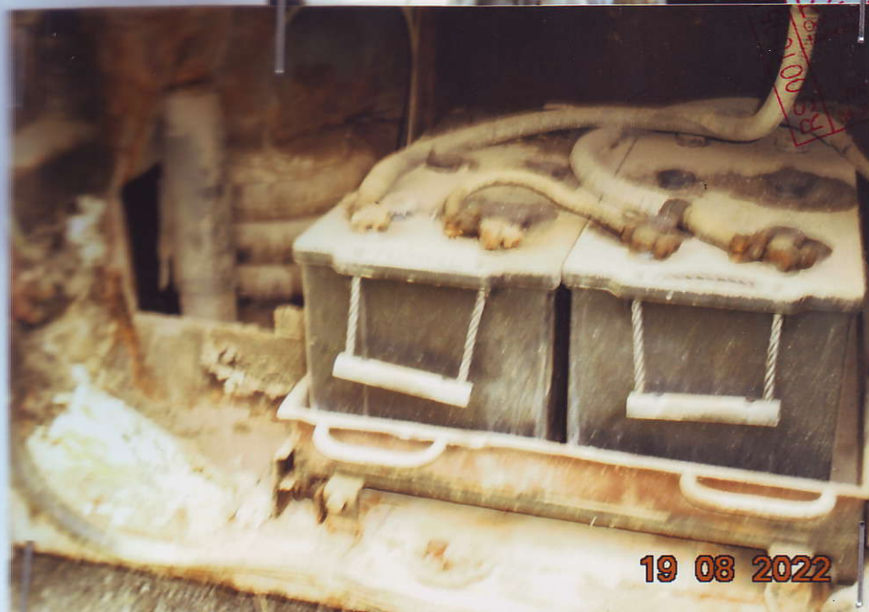
(12 ) Lewy tył zawieszenia i za nim osadzone są dwa akumulatory . 12 V x 2 sztuki., 135 Ah – sprawne . Pomimo dłuższego postoju autobusu , silnik uruchomiono .