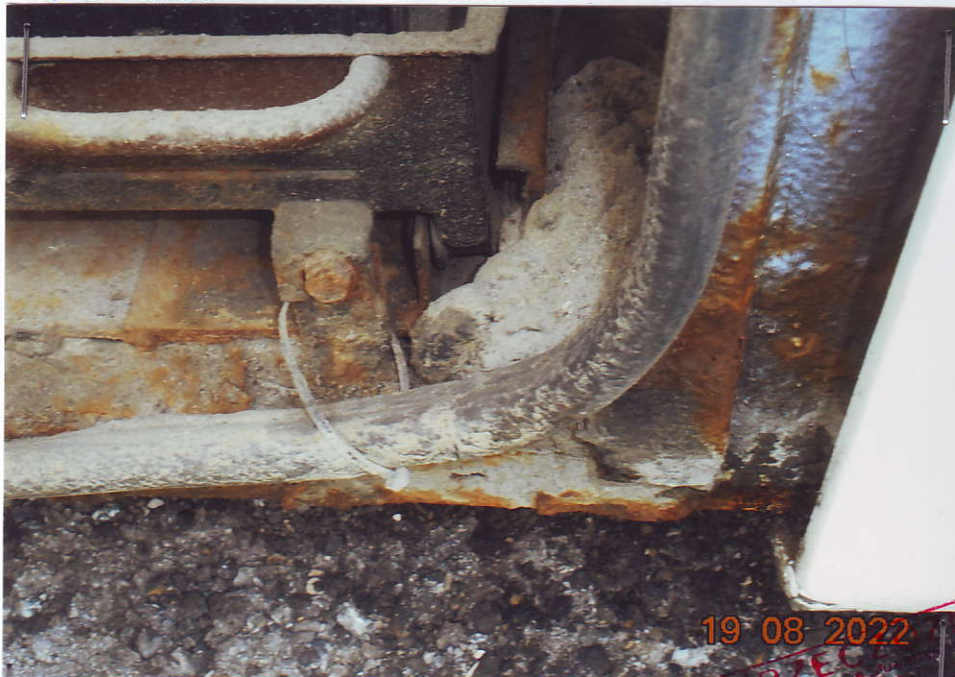
AUTOBUS SOR C9,5 o nr rejestracyjnym SZY 14708

MATERIAŁ POGLĄDOWY – dok. fot. Załącznik do Oceny technicznej nr 9 / 22 /UG / M autobusu SOR C9,5 , o nr rej. SZY 14708 .