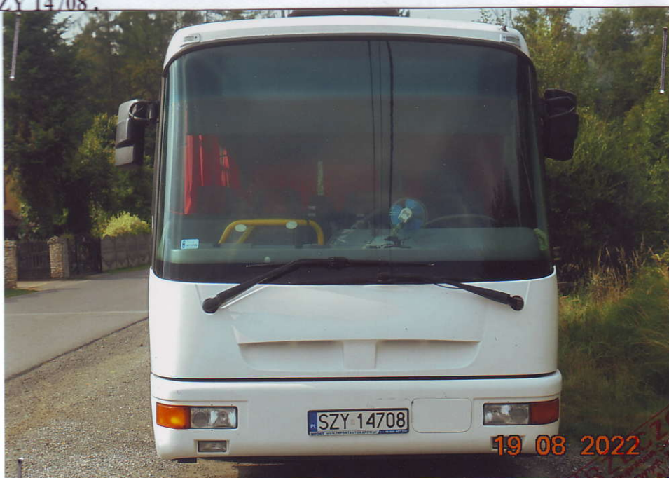
AUTOBUS SOR C9,5 o nr rejestracyjnym SZY 14708