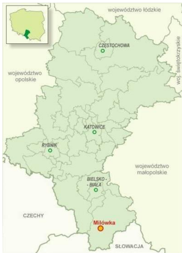
Mapa 1. Lokalizacja Gminy Milówka na tle Województwa Śląskiego

Ważnym elementem położenia Gminy jest lokalizacja ważnych ciągów komunikacyjnych – drogi DK 1 (w części jako droga ekspresowa S1 – Bielsko-Biała – Zwardoń - granica państwa) oraz drogi Żywiec – Koniaków – Istebna – Wisła. Pierwszy ciąg związany z ruchem tranzytowym, a drugi głównie turystycznym. Obie drogi mają wpływ na życie i rozwój gospodarczy Gminy.