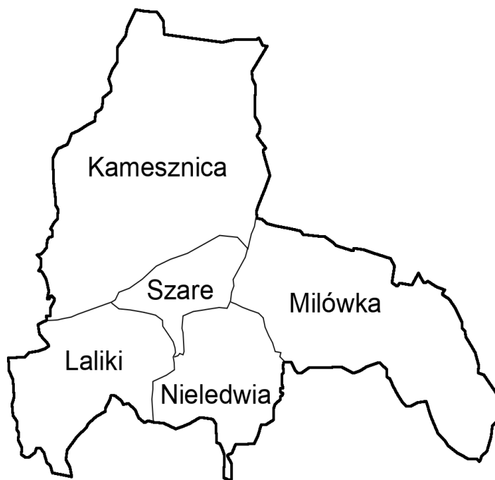
Mapa 2. Mapa gminy Milówka – lokalizacja sołectw Gminy